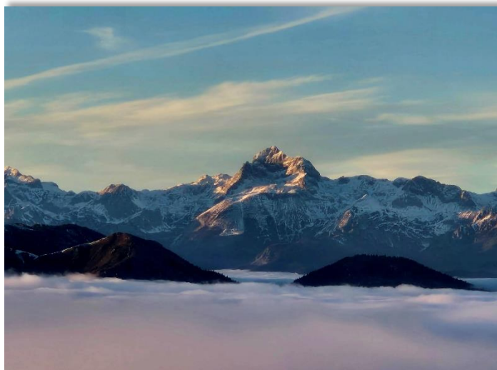
Pogled na Triglav